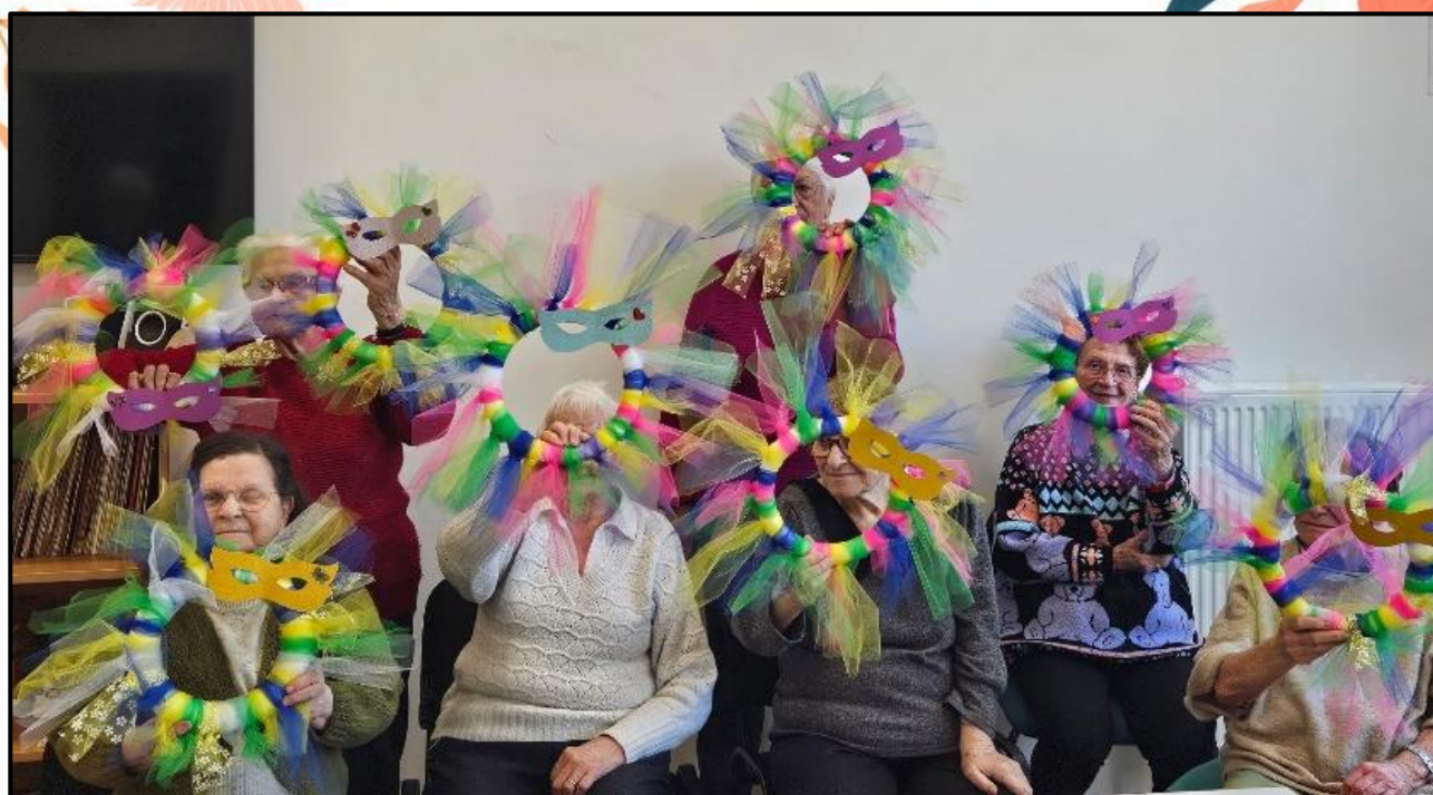
Activités autour de Carnaval.