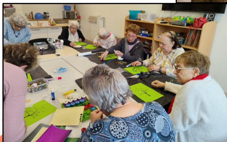
Atelier manuel : Arbre de Printemps.