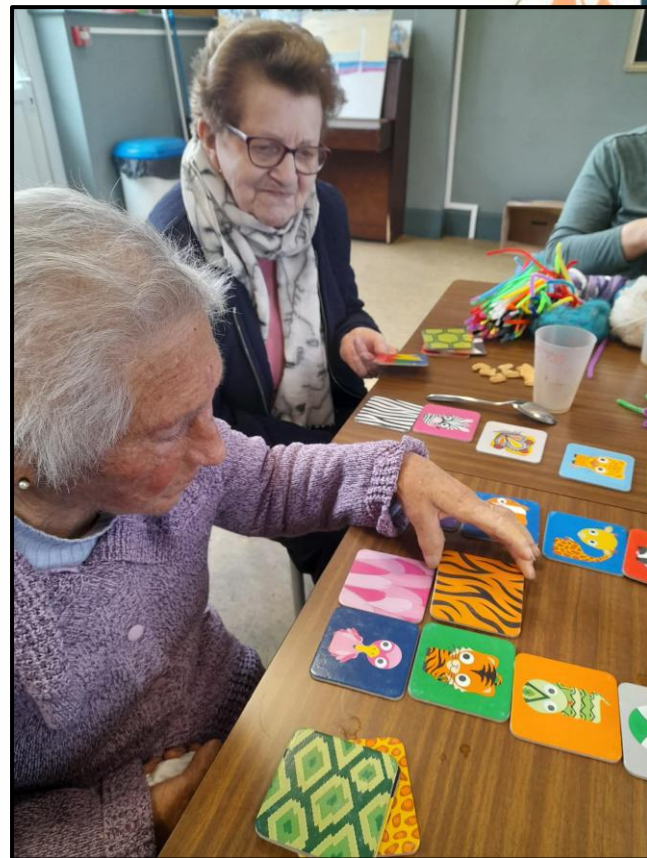
Bricolage et jeux divers.